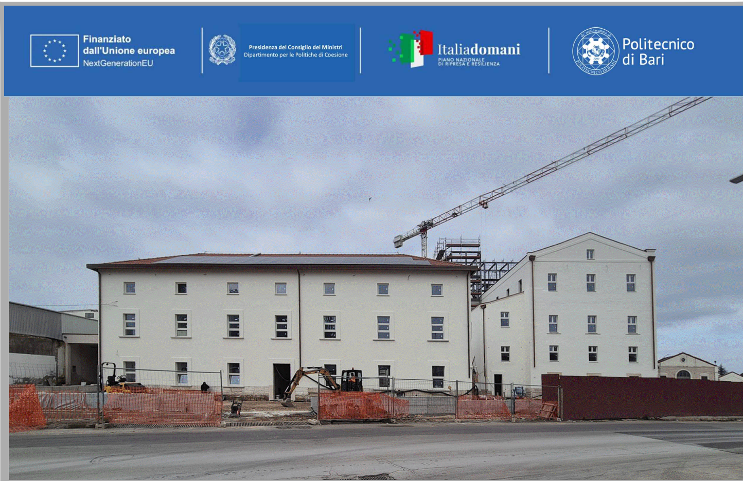
FORNITURA E POSA IN OPERA DI COMPONENTI DI ARREDO E PARETI VETRATE PRESSO L'AGRIFOOD HUB